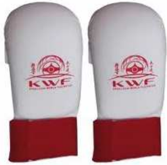
GUANTILLAS (DE 8 A 13 AÑOS)