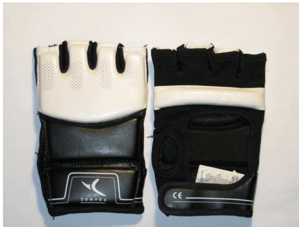
Guantillas para la categoría juvenil (14-15 años) (se puede utilizar modelo similar aprobado por el Jefe de Árbitros)

Se permitirán otro tipo de protecciones siempre que ofrezcan el mismo nivel de protección que las expuestas.