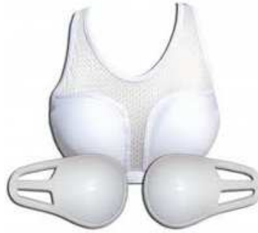
PROTECTOR DE PECHO